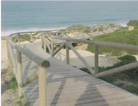
Instalación de pasarelas de acceso a la playa