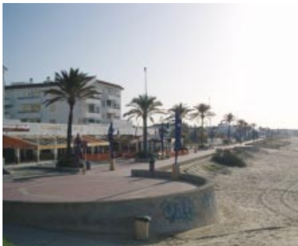
Paseo marítimo de Chiclana