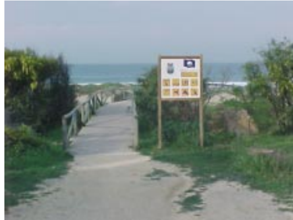
Instalación y adecuación de senderos

método de evaluación. Se optimizan las infraestructuras en el ámbito de la playa, mejorando su aspecto y facilitando la accesibilidad y uso público. Existen registros con datos clave de años anteriores que pueden servir de base para plantear cambios que den lugar a mejoras.