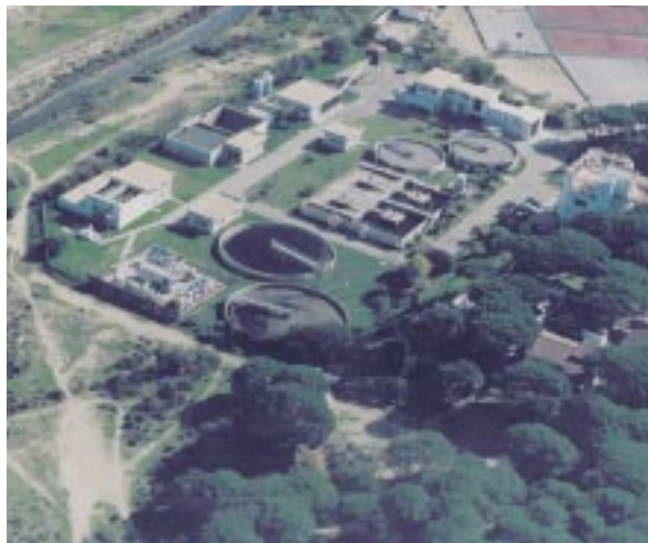
Estación depuradora de aguas residuales " La Barrosa"

y amenazas que se ciernen sobre el litoral de Chiclana de la Frontera.