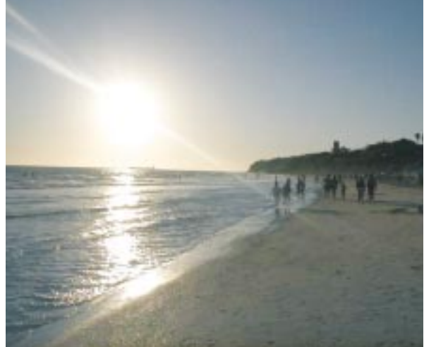
Vista al atardecer de la playa de Chiclana de la Frontera