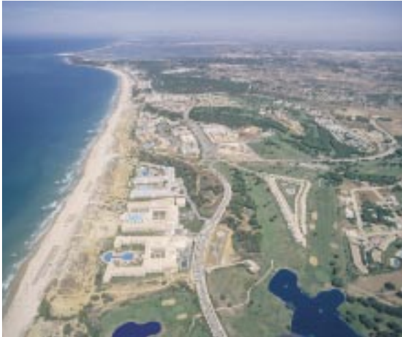
Vista aérea del litoral